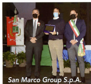
San Marco Group S.p.A.