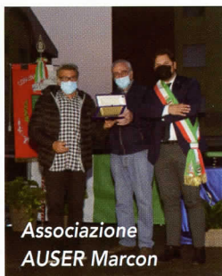
Associazione AUSER Marcon