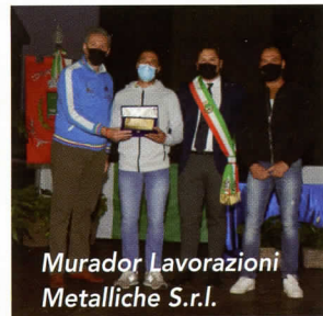
Murador Lavorazioni Metalliche S.r.l.