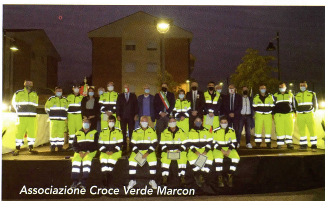
Associazione Croce Verde Marcon