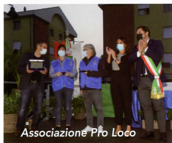
Associazione Pro Loco