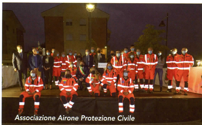
Associazione Airone Protezione Civile