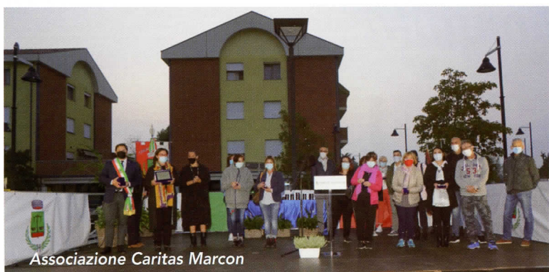
Associazione Caritas Marcon