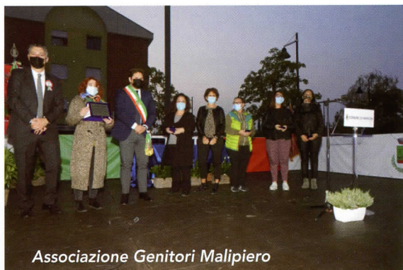
Associazione Genitori Malipiero