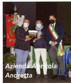
Azienda Agricola Andretta