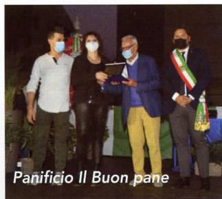
Panificio Il Buon pane