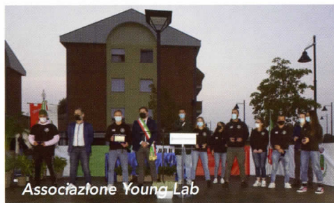
Associazione Young Lab