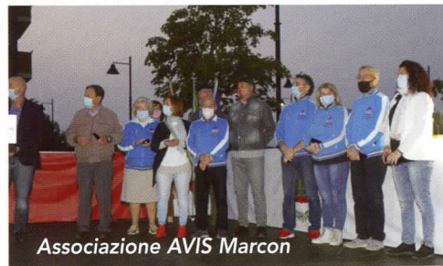
Associazione AVIS Marcon