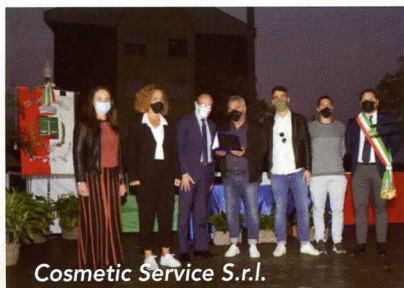
Cosmetic Service S.r.l.