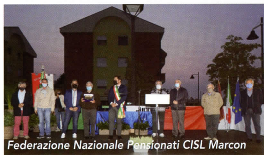
Federazione Nazionale Pensionati CISL Marcon